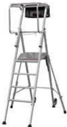
T PLIANT 5