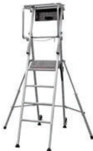
T PLIANT 6