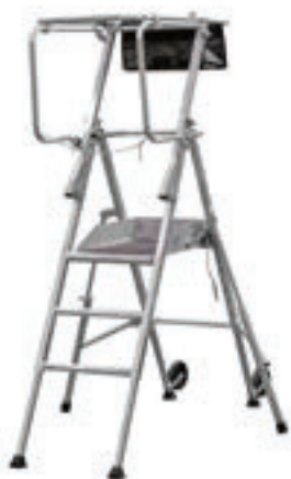
T PLIANT 4